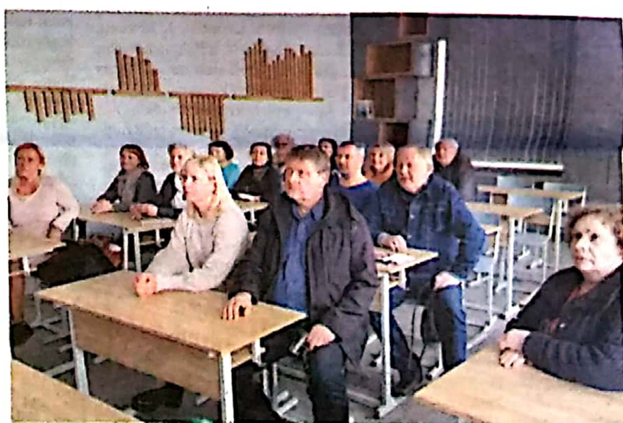
Kolegų pranešimų klausosi Kaišiadorių Algirdo Brazausko gimnazijos mokytojai